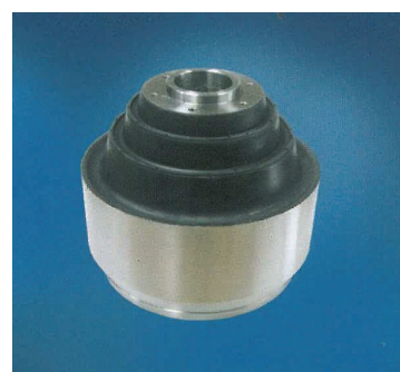
Конусообразные виброизоляционные опоры