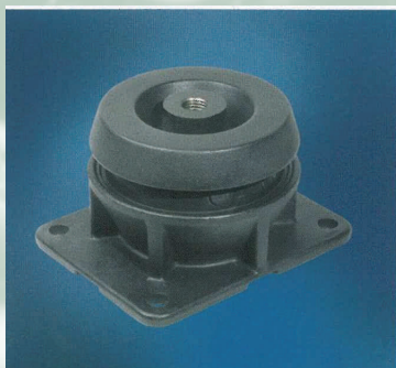
Опоры для двигателей и генераторов